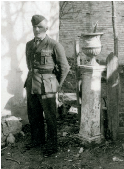
Soldat de la Legió Cóndor alemanya a Vilafranca del Penedès el gener de 1939.