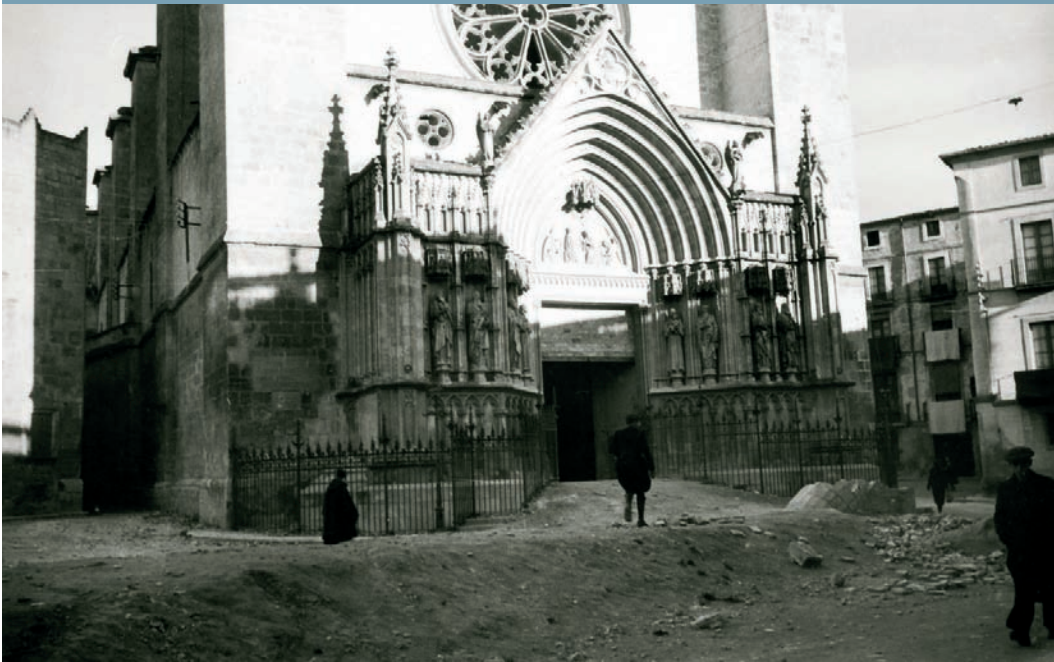
Façana de la basílica de Santa Maria i plaça de Jaume I de Vilafranca del Penedès. Gener de 1939. Es pot veure l'empremta del refugi soterrani i una de les entrades.

Fa setanta anys que les tropes franquistes ocupaven el Penedès en el seu imparable camí de l'anomenada Campanya de Catalunya. I tot i que n'han passat més de trenta des de la fi del franquisme formal, un vel de silenci i oblit segueix planant sobre aquest període sagnant de la nostra vida col·lectiva. Per això, avui obrim les finestres de la història i espolem l'estora de les vergonyes il·lustrant amb imatges desconegudes per la majoria de penedesencs.