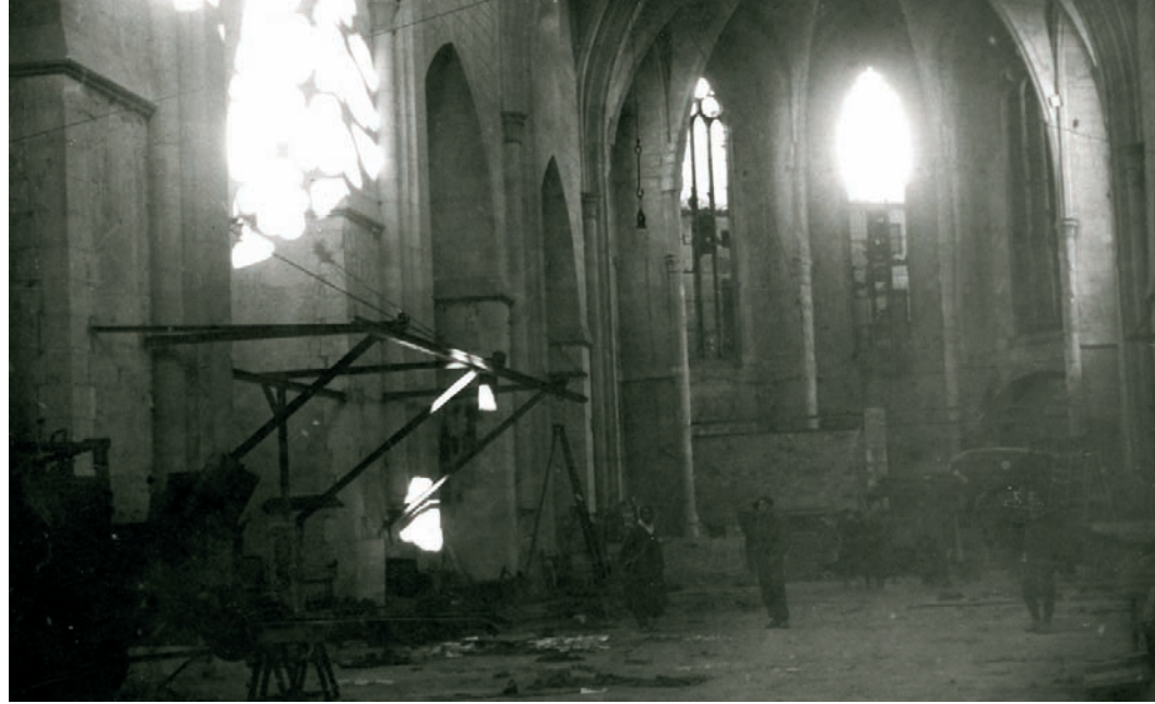
Interior de la basilica de Santa Maria de Vilafranca del Penedès el gener de 1939. Durant la guerra va ser utilitzada com a taller i magatzem.

Penedès i l'Anoia, la 13a Divisió seguí la carretera N-340, i la 105a Divisió anà paral·lela a la costa, mentre que la 50a restà de reserva. L'estratègia seguida per les tropes republicanes per tal d'endarrerir l'avanç de les tropes franquistes fou la de destruir els ponts, tant del ferrocarril, com de carretera. La major part dels ponts del ferrocarril i de la carretera N-340 al Penedès foren volats