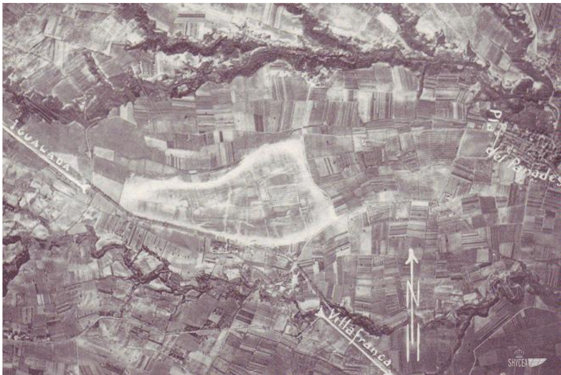
Foto 1. Vista aèria del camp d'aviació l'any 1938.