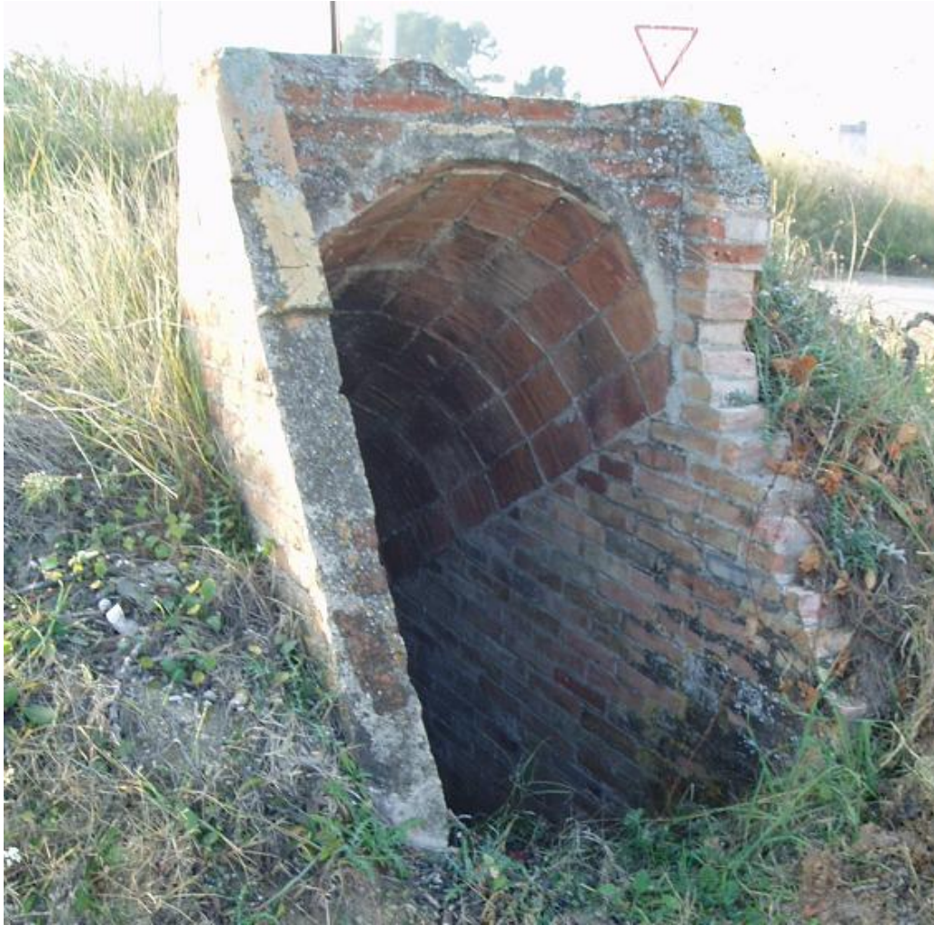
Foto 2. Una de les entrades d'un refugi petit que encara es serva.

En el camp es bastiren refugis fets amb maons d'una obra d'un veí de Sabanell. El refugi gran tenia una rampa d'uns 50 metres, feia un tomb i després hi havien escales. Quan s'arribava a baix hi havia cinc o sis habitacions, un passadís i una altra sortida a la vinya de cal Rei. També hi havia un respirador. Entre les dues boques d'entrada d'aquest refugi hi havia la caseta de comandament, que una bomba va destruir i va haver de ser refeta. Al voltant del camp es podien trobar diferents refugis més petits pels aviadors en cas de bombardeig.