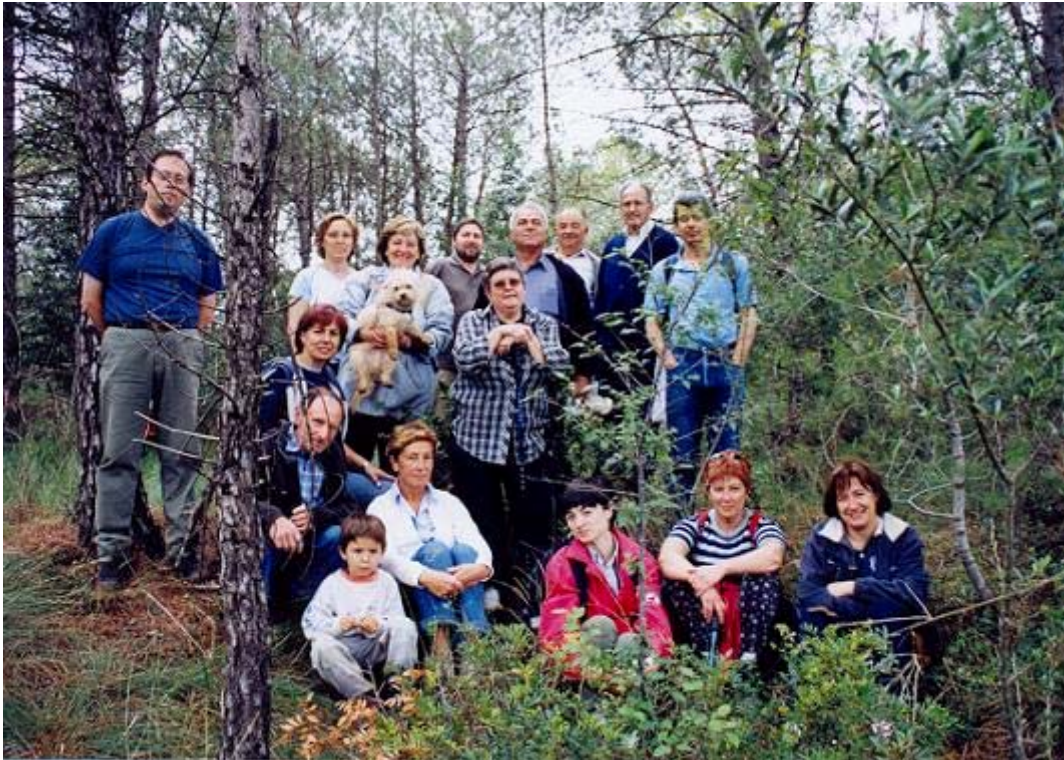
Foto 4. Membres del Grup de Recerques amb altres acompanyants davant del cràter que va deixar la bomba al costat de la vinya de cal Serenet (maig del 2003)

sento cap allà a l'Altra Banda : Boooooooooooooom!. Després en van caure d'altres espaiades fins a Cabrerd'.